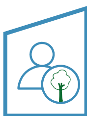
Regaliamo un albero ad ogni rivenditore PosaClima

In collaborazione con Treedom, un'organizzazione dedicata alla riforestazione globale, stiamo creando la nostra foresta PosaClima. Regaleremo un albero per ogni rivenditore PosaClima e destineremo una quota del fatturato generato dai prodotti Green all'acquisto di nuovi alberi. Questa iniziativa non solo contribuirà a combattere il cambiamento climatico, ma rappresenterà anche un simbolo del nostro impegno verso un futuro più verde e sostenibile